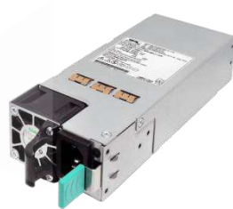
TG17-0800-01 CRPS 1U 電源供應器